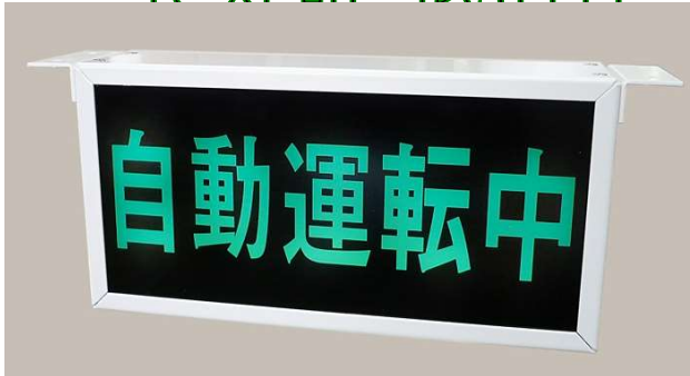
アンドン SA830 点灯中 上部取付