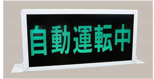
アンドン SA830 点灯中 下部取付